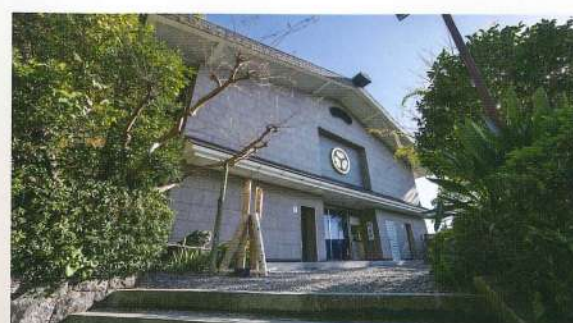
久能山東照宮博物館

【お問い合わせ】 TEL.054-237-2438 https://www.toshogu.or.jp/