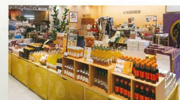
門前の恵み たいらぎ

【お問い合わせ】 TEL.054-340-1172 https://nihondaira-yume-terrace.jp/