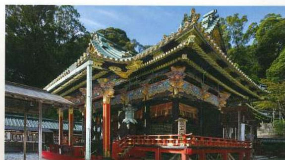
国宝社殿 久能山東照宮

元和3年(1617)に徳川家康公を祀る霊廟として創建され、社殿は江戸時代初期の代表的な建築様式「権現造り」で建てられており、総漆塗りと極彩色の装飾が施された豪華絢爛な建物です。その壮麗な社殿をぜひご堪能ください。